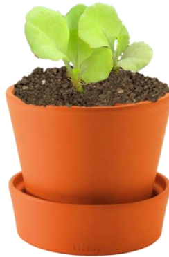
รูปที่ ๔.๒ Green Organic ชุดปลูกผักในคอนโด ระยะเวลา ๔ สัปดาห์