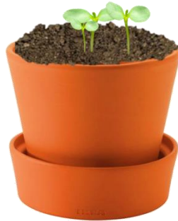
รูปที่ ๔.๑ Green Organic ชุดปลูกผักในคอนโด ระยะเวลา ๒ สัปดาห์

ระยะการดำเนินการสร้าง Green Organic ชุดปลูกผักในคอนโด ตามระยะเวลาการเพาะปลูก ดังแสดงในรูปที่ ๔.๑ - รูปที่ ๔.๓