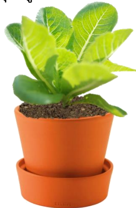
รูปที่ ๔.๓ Green Organic ชุดปลูกผักในคอนโด ระยะเวลา ๖ สัปดาห์